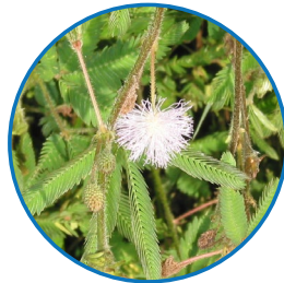
Maleza semi-leñosa: Dormidera/Dormilona ( Mimosa pudica ) familia fabaceae