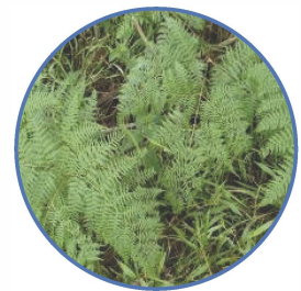
Maleza especial: Helecho ( Pteridium aquilinum ) familia hypolepydacea

4. Especiales: debido a que no se pueden clasificar como mono ó dicotiledónea; aquí encontramos a los helechos los cuales son plantas que no producen flores, frutos o semillas y se reproducen mediante esporas que se encuentran en el envés de las hojas. La muerte total en este tipo de malezas se da entre 60-120 días después del tratamiento herbicida.