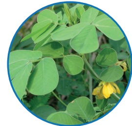
Maleza herbácea: Bicho/Hediondilla ( Senna obtusifolia ) familia fabaceae

1. Herbáceas: durante todo su ciclo de vida presentan un tallo de color verde y acuoso que se quiebra fácilmente y son de mayor susceptibilidad al control por parte de los herbicidas; presentan muerte total de raíz entre 30-45 días después de haber sido tratadas.