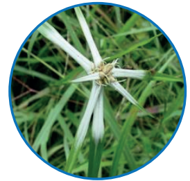
Ciperácea Estrellita blanca ( Dichromena ciliata )

El segundo grupo y de mayor importancia, debido a su gran cantidad y diversidad en los potreros son las de hoja ancha. Dentro de las principales familias botánicas pertenecientes a este grupo encontramos las malváceas, fabáceas, euphorbiáceas, myrtáceas y asteráceas por solo mencionar algunas. Este grupo se encuentra subdividido en 4 tipos según la consistencia de su tallo, los cuales son: