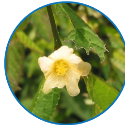
Escoba/ Escobilla ( Sida acuta ) Maleza familia malvacea

2. Semi-leñosas: el tallo tiene una coloración café o rojiza durante su desarrollo y este no se quiebra fácilmente. Son de más difícil control que las malezas herbáceas por parte de los herbicidas y presentan muerte radicular luego de haber sido tratadas entre 45-60 días después de la aplicación.