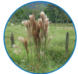
Gramínea Rabo de zorro ( Andropogon bicornis )