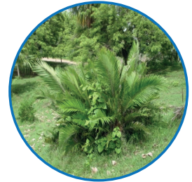
Palmacea Palma lata ( Bactris minor )