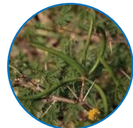
Maleza Leñosa: Aromo, Pelá, Huizache, Subinché ( Acacia farnesiana ) familia fabaceae

2. Semi-leñosas: el tallo tiene una coloración café o rojiza durante su desarrollo y este no se quiebra fácilmente. Son de más difícil control que las malezas herbáceas por parte de los herbicidas y presentan muerte radicular luego de haber sido tratadas entre 45-60 días después de la aplicación.